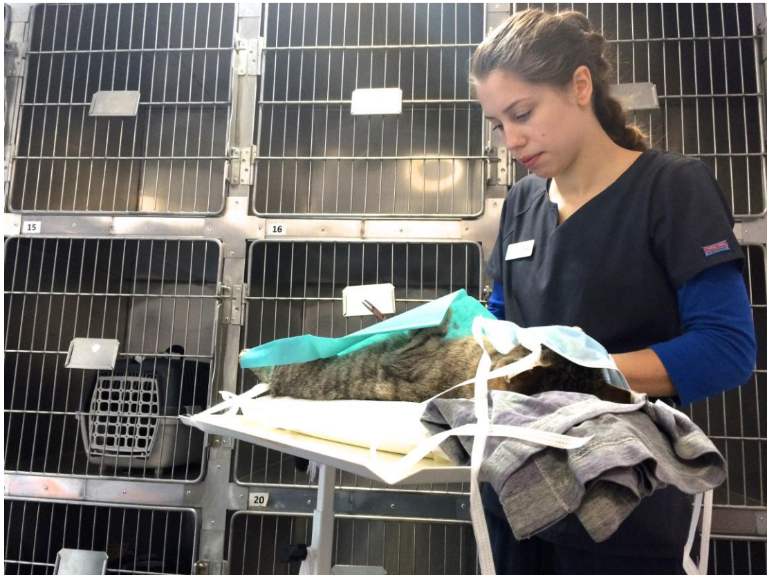
Unsere Studenten – an jedem Projekttag 4 andere – arbeiten hochkonzentriert.