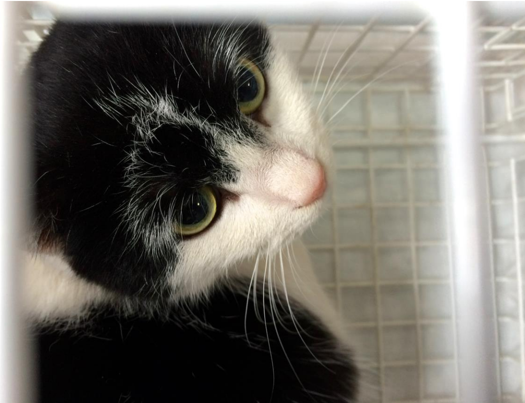
Eine unserer vielen Patientinnen vor der Narkose im Käfig.