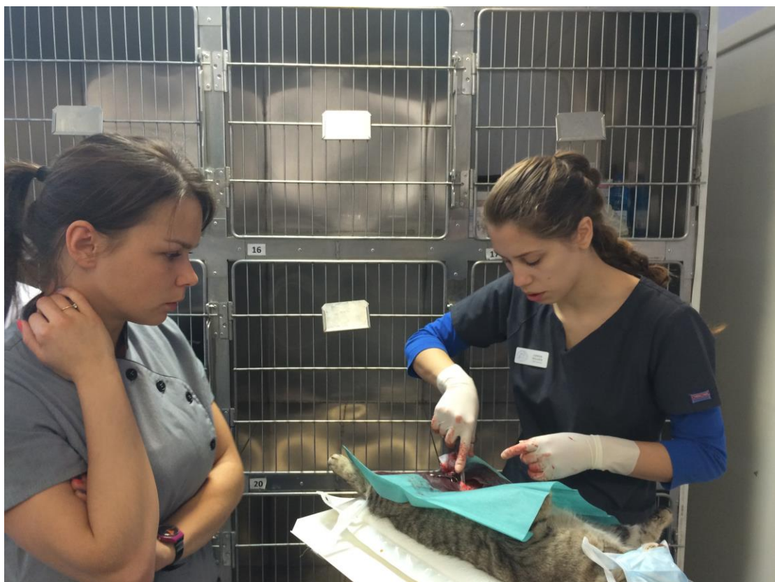
Jeder Schritt der OP wird von unseren Tierärzten überwacht.