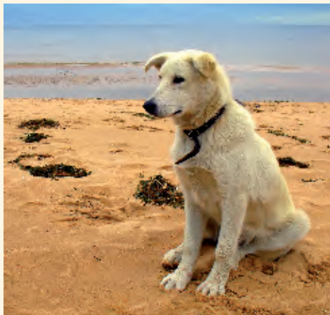
Vor dem Urlaub mit dem Hund bitte den Tierarzt konsultieren