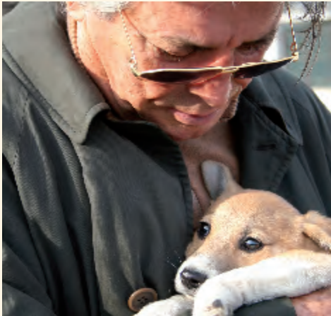
Pierre Brice („Winnetou“) engagiert sich für rumänische Straßenhunde

Es scheint ganz so, als ob Osteuropa im Hinblick auf den Tierschutz die Zeichen der Zeit erkannt hat und Willens ist, zu handeln. Nachdem Bulgarien im Januar diesen Jahres ein sehr fortschrittliches Tierschutzgesetz verabschiedet hatte, das unter anderem das Töten von Straßenhunden verbietet, will Rumänien jetzt nachziehen. Sobald das neue Streunerhundegesetz verabschiedet sein wird, sind die Kommunen verpflichtet, die Hundepopulation in ihren Städten nicht - wie in der Vergangenheit - durch Massentötungen zu lösen, sondern auf