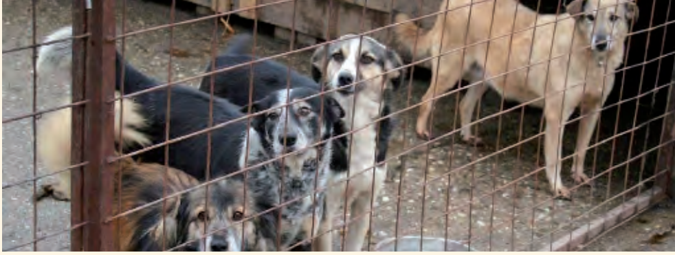
Diese Hunde hatten Glück: sie sind geimpft, kastriert und bereits beim bmt in Deutschland. Jetzt warten sie nur noch auf ein liebevolles Zuhause.

Es scheint ganz so, als ob Osteuropa im Hinblick auf den Tierschutz die Zeichen der Zeit erkannt hat und Willens ist, zu handeln. Nachdem Bulgarien im Januar diesen Jahres ein sehr fortschrittliches Tierschutzgesetz verabschiedet hatte, das unter anderem das Töten von Straßenhunden verbietet, will Rumänien jetzt nachziehen. Sobald das neue Streunerhundegesetz verabschiedet sein wird, sind die Kommunen verpflichtet, die Hundepopulation in ihren Städten nicht - wie in der Vergangenheit - durch Massentötungen zu lösen, sondern auf