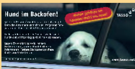
TASSO-Bestellkarte „Hund im Backofen“ zum Verteilen

Fordern Sie jetzt unter www.tasso.net unsere kostenlosen Karten und Plakate zum Verteilen an. Wichtig: Bitte Ihre komplette Anschrift und die Anzahl der gewünschten Karten oder Plakate angeben. Vielleicht retten Sie ja ein Tierleben!