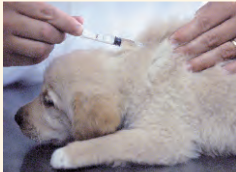
Tierhalter sind versichert: Wie wichtig ist Impfen noch?

Ihrem Tierarzt bedarf. Außerdem ist für diesen verlängerten Impfschutz Voraussetzung, dass der gesunde Welpen in den dafür vorgesehenen Zeiträumen die Grundimmunisierung erhalten hat. Und zwar sollte man Hundewelpen zwischen der sechsten und achten Woche gegen Parvovirose und Zwingerhusten impfen. Zwischen der achten und zehnten Woche muss dann gegen Staupe sowie Leptospirose und zwischen der zehnten und zwölften Woche noch mal gegen Parvovirose und Zwingerhusten geimpft werden. Zwischen der zwölften und vierzehnten Woche sind Staupe, Hepatitis, Leptospirose sowie Tollwut fällig und in der sechzehnten Woche erneut die Parvovirose. Dann muss die komplette Kombinationsimpfung nach einem Jahr wiederholt werden. Erst danach herrscht die Grundimmunisierung. Es spricht aber auch nichts dagegen, wenn Sie die komplette Kombinationsimpfungen einmal im Jahr geben lassen.