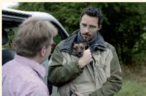
TASSO warnt: Keine Hunde auf Parkplätzen oder Wochenmärkten kaufen!

Es ist ein grausames Geschäft mit wehrlosen, gerade geborenen Lebewesen, das in Zahlen gar nicht mehr zu fassen ist. Genährt wird es durch Mitleid und Unwissenheit der Käufer einerseits sowie durch erbarmungslose Skrupellosigkeit profitgieriger Händler andererseits. Das Angebot an jungen Hunden jeder Rasse, Farbe und Größe zu Dumpingpreisen übersteigt die Nachfrage bei weitem und wächst fast monatlich. Dabei kommen die halb verhungerten, ausgemergelten, durch ganz Europa gekarteten und viel zu früh von der Mutter getrennten Tiere nicht mehr nur aus Osteuropa, wie man früher dachte. Belgien und die Niederlande sind jüngst der Umschlagplatz Nummer 1, weil es so viel seriöser klingt. Deutschland ist leider das Hauptabnehmerland für diesen tierschutzwidrigen Handel. Die Massenproduktion der Welpen – überwiegend in Osteuropa – unter widrigsten Bedingungen, ohne Licht und zusammengepfercht auf engstem Raum kostet in den „Erzeugerländern“ nur zirka 30,- Euro pro Tier. In den Abnehmerländern werden die Tiere dann „günstig“ für einige hundert Euro angeboten, was meist immer noch weniger als die Hälfte des marktüblichen Preises ist. Die Tiere sind oft nicht geimpft und entwurmt und werden deswegen oft schon mit tödlichen Krankheiten verkauft. Darüberhinaus