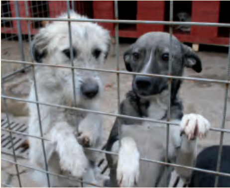
Gerettet aus der Tötungsstation warten die beiden beim bmt auf eine neues Zuhause

bmt und TASSO übergeben Resolution an EU – Danke an alle TASSO-Leser