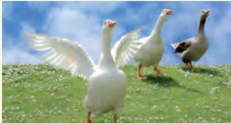
Wenn schon Weihnachtsgans, dann bitte aus artgerechter Haltung!

In Frankreich ist sie Ausdruck höchster Gaudiumfreude und dort seit 2005 sogar vom Parlament zu einem geschützten kulturellen und gastronomischen Erbe erklärt worden. Doch die Pâté de foie gras , so der Name der nationalen Leibspeise der Franzosen, kann nur dadurch entstehen, dass Gänse Jahr für Jahr unendlich leiden müssen. Den Tieren wird zwei- bis dreimal pro Tag ein zirka 50 Zentimeter langes Rohr durch den Hals direkt in den Magen eingeführt und damit 2,5 Kilogramm stark gesalzener Reisbrei! Das mästet die Tiere und die Leber. Diese tierquälerische Prozedur führt nach nur 12 Wochen dazu, dass die Gänse nicht nur eine um das 10-fache vergrößerte Leber haben, die dann zu eben diesem Leckerbissen verarbeitet wird. Verletzungen am Hals und Magen sowie geplatzte Mägen sind die Regel, Gelenkschmerzen und durch die vergrößerte Leber verursachte Atem-