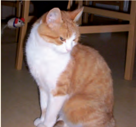
Simba, zufrieden, wieder bei seiner Familie zu sein