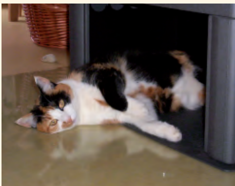
Anabell war von dem Artgenossen zunächst nicht sehr angetan