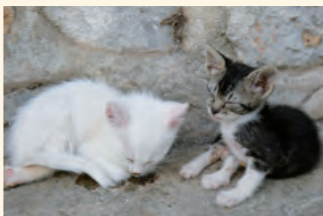
Zum Leben auf der Straße verurteilt – Streunerkatzen