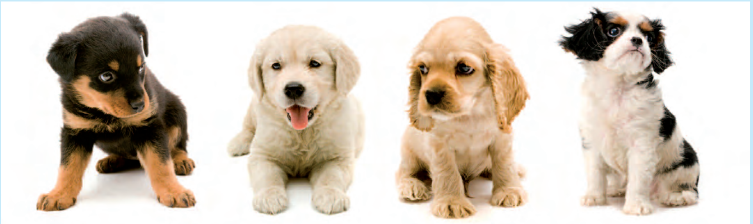
Eine vorsorgliche Registrierung schützt ein Leben lang vor Verlust

Über 400.000 Tiere entlaufen Jahr für Jahr. Die meisten kommen nach kurzer Zeit von alleine zurück. Doch oft genug wird die Leistung eines Haustierzentralregisters in Anspruch genommen, um ein entlaufenes Tier schnell zu seinem Besitzer zurückzubringen. TASSO wollte wissen, wie Tierhalter in Deutschland über eine vorsorgliche Registrierung denken und welche Hilfe sie in Anspruch nehmen würden, wenn ihr Tier entläuft.