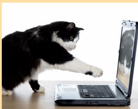
Registrierung ist Tierschutz und spart Tierheimen 20 Mio EUR

Wolfgang Apel vom Deutschen Tierschutzbund e.V. forderte unlängst eine Lösung für die größtenteils finanziell schwer angeschlagenen deutschen Tierheime von den Kommunen. Zu recht! Denn die Kommunen finanzieren nur einen Bruchteil der tatsächlichen Aufwendungen der Tierheime. Umfragen des Deutschen Tierschutzbundes unter 144 Tierheimen zufolge seien allein hier rund 20 Millionen Euro Investitionsbedarf nötig. Wenn sich