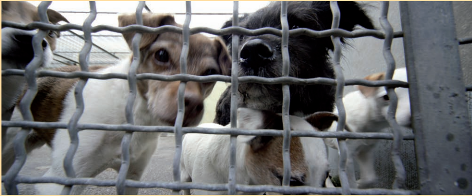
Gesetzliche Registrierungspflicht: Ja oder nein? Sagen Sie uns Ihre Meinung auf www.tasso.net