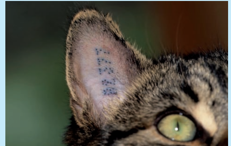
Ein starkes Doppel: Tätowierung und Registrierung bei TASSO

Kennzeichnung und Registrierung: Das ist im Verlustfall ein starkes Doppel für jedes Haustier. In der Datenbank von TASSO sind 6.700 Tätowierungscodes fast aller Tierärzte in Deutschland, Österreich und der Schweiz hinterlegt. Auch wenn ein Fundtier nicht registriert ist, kann es dank Kennzeichnung oft dem behandelnden Tierarzt zugeordnet werden.