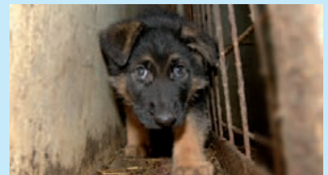
Katastrophale Zustände sind ein Indiz für Unseriosität

Leider nur sehr schwer. Die Geldgier hat diese Menschen unempfindlich für das Leid Anderer gemacht. Inzwischen sehr erfindereich geworden, passen sie sich dem Markt blitzschnell an. So weist beispielsweise fast jeder unseriöse Händler stolz darauf hin, dass seine Tiere gechipt sind. Bei den EU-Heimtierausweisen kann man manchmal nicht mehr zwischen gefälscht und echt unterscheiden. Manche private „Verkaufsorte“ sind sauber und erwecken einen vertrauenswürdigen Eindruck. Auch sehen die Hunde nicht immer krank aus.