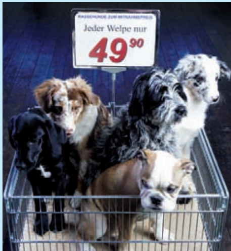
„Wühltischwelpen“ - eine gemeinsame Aktion von TASSO, ETN und bmt

TASSO, der ETN und der Bund gegen Missbrauch der Tiere machen mobil