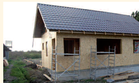
Hilfe zur Selbsthilfe: OP-Saal in Tirgu Mures im Bau

Im August 2010 gab es die ersten Gespräche vor Ort, und nur 8 Wochen später im Oktober unterzeichneten die drei Tierschutzorganisationen TASSO, der Europäische Tier- und Naturschutz und der Bund gegen Missbrauch der Tiere bereits einen Freundschaftsvertrag mit der rumänischen Stadt Tirgu Mures. So findet der Auslandstierschutz in Rumänien zum zweiten Mal seit Beginn der deutschen Hilfe vor 5 Jahren auch die Zustimmung der rumänischen Behörden. Ein Novum in einem Land, in dem nach wie vor über das massenweise staatliche Töten aller Hunde diskutiert wird. Die Stadt Tirgu Mures stellte für ein Operationsgebäude ein großzügiges Gelände neben dem Tierheim und finanzielle Mittel zur Verfügung. Die Tierschutzorganisationen werden mit der OP-Ausstattung, einem älteren Transportfahrzeug, Zäunen und Zwingern helfen. Der Bürgermeister der Stadt, Dorin Florea, freut sich und sicherte die Eröffnungsfeier des OP-Saales für Anfang November zu. „Nach Bals kann nun auch Tirgu Mures wegweisend für ganz Rumänien werden“, so Philip McCreight, Leiter der Tierschutzorganisation TASSO in Hattersheim. „Die Verantwortlichen der Stadt haben sofort verstanden, dass Kastrieren die einzige zukunftsweisende und damit nachhaltige Lösung für das Straßenhundeproblem im Ausland ist. Deutsche Hilfe ist hier herzlich willkommen.“