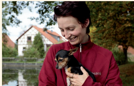
Wo war Cortita nur das ganze Jahr über? Wie konnte sie überleben?