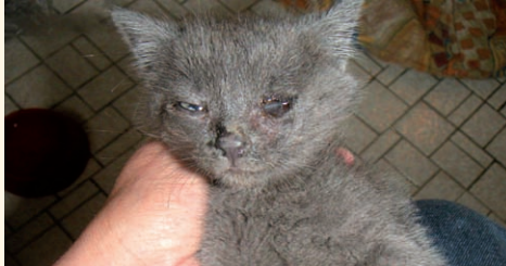
Die Kapazitäten der Tierschützer sind ohne fremde Hilfe erschöpft