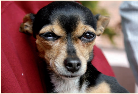
Cortita: Nach einem Jahr endlich wieder zuhause