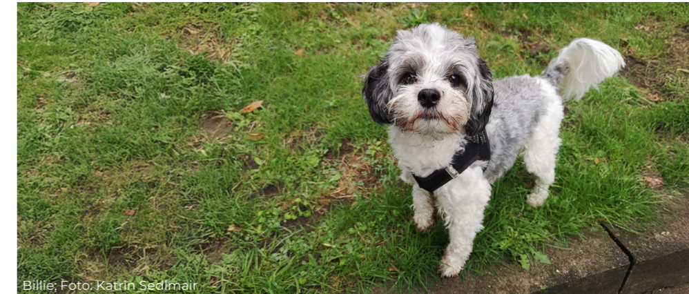
Billie, Foto: Katrin Sedlmair